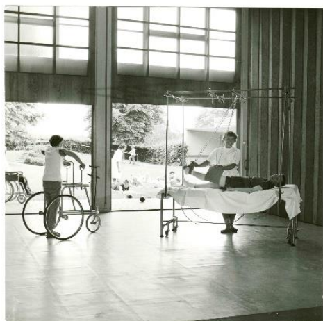
Krankengymnastik 1950er Jahre