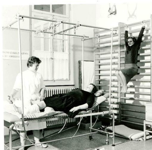
Krankengymnastik 1950er Jahre